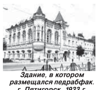
Здание, в котором размещался педфаком г. Пятигорск. 1933 г.

Балкарии огромную помощь оказали ведущие учебные заведения и научные учреждения страны оборудованием, педагогическими кадрами, литературой и т.д.» Кабардино-Балкарский педагогический институт постепенно становился культурным центром региона. Его преподаватели принимали активное участие в