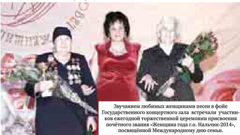
Звучанием любимых женщинами песен в фойе Государственного концертного зала встречали участниц ежегодной торжественной церемонии присвоения почётного звания «Женщина года г.о. Нальчик-2014», посвящённой Международному дню семьи.