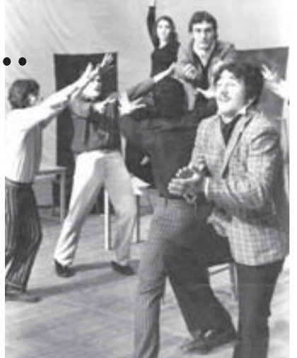
«Учить можно только действию как внутреннему движению, направленному куда-то. Научить чувствам нельзя»