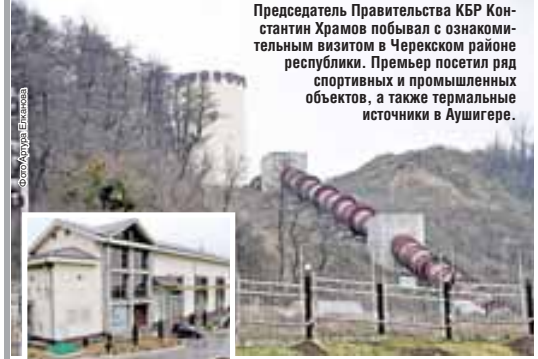
Председатель Правительства КБР Константин Храмов побывал с ознакомительным визитом в Черекском районе республики. Премьер посетил ряд спортивных и промышленных объектов, а также термальные источники в Аушигер.