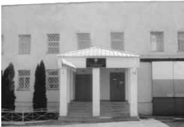
Административное здание следственного изолятора №1 Управления Федеральной службы исполнения наказаний России по КБР (г. Нальчик, ул. Отарова, 20).

«Социальные лифты» были введены в систему Федеральной службы исполнения наказаний России в октябре 2010 года в рамках Концепции развития уголовно-исполнительной системы РФ до 2020 года. Суть «социальных лифтов» заключается в том, что специальная комиссия примерно раз в три месяца рассматривает личные дела осуждённых, которым в соответствии с законом можно заменить не отбытую часть срока более мягким видом наказания либо условно-досрочным освобождением.