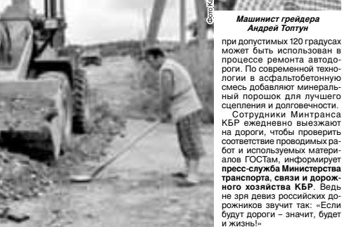
Дорожные работы на Цемзаводе на Белой речке