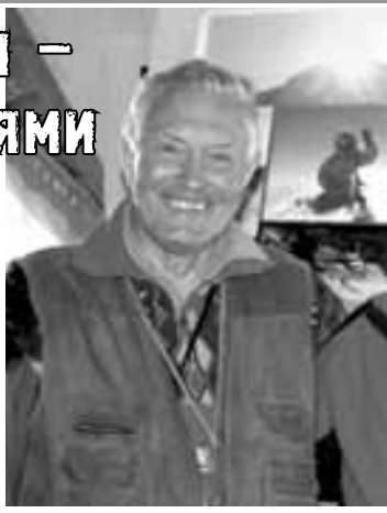
выбрать свой путь... Сам автор так обозначил цель справочника...