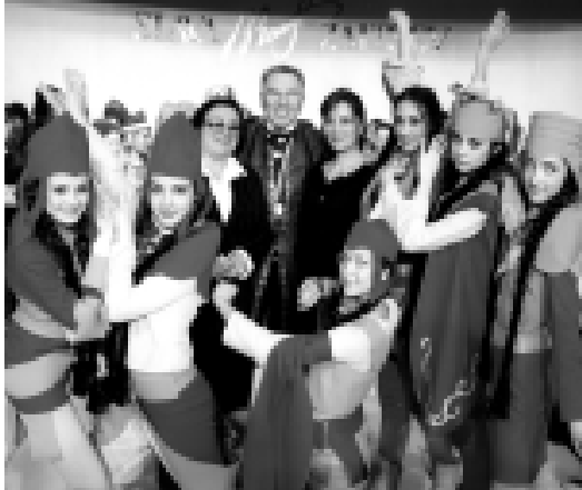
Победители конкурса «Золотая игла» с Вячеславом Зайцевым.

«Свадебная коллекция отражает наше видение современной моды в национальной одежде».