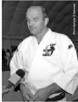
Материалы рубрики подготовил спортивный обозреватель Альберт ДЫШЕКОВ.