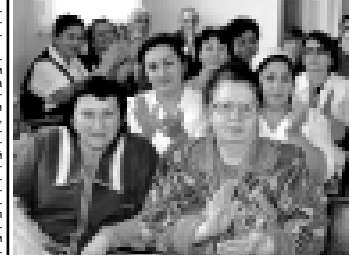
Сотрудники операционно-розничной сети ГУВД по краю задержали трех организаторов бизнеса...