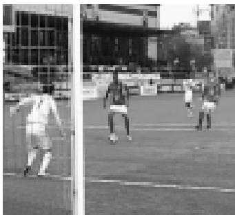
Матчи между «Тереком» и «Спартак-Нальчик» всегда носят принципиальный характер. Не стала исключением и очередная игра. Хотя с турнирной точки зрения очки нужны были больше...