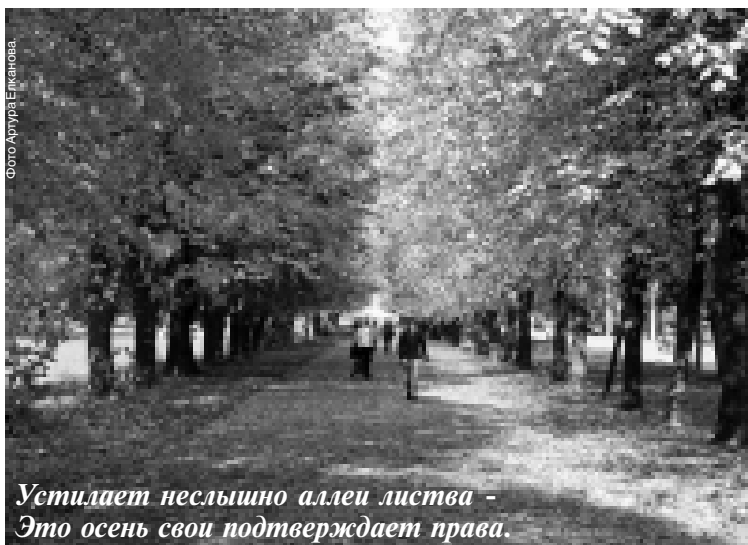
Устилает неслышно аллею листва - Это осень свои подтверждает права.