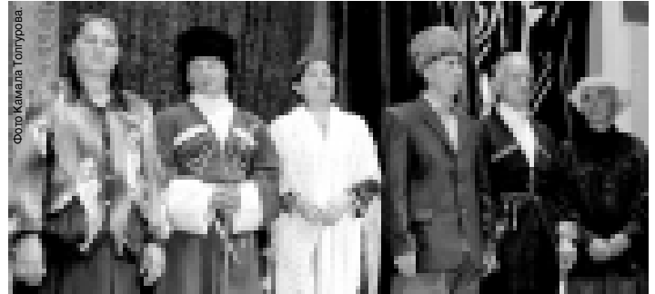
Фото: Камала Мамучиева