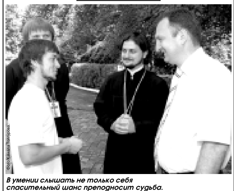
В умении слышать не только себя спасительный шанс преподносит судьба.