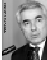
Фото Руслан Мамаев