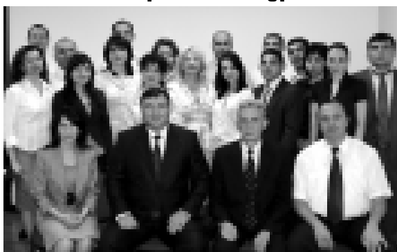
Сотрудники Управления выражают благодарность гражданам...

Каждый житель России, независимо от того кто он - студент или пенсионер, государственный служащий или частный предприниматель - ежедневно сталкивается с проявлениями конкуренции... (Окончание текста)