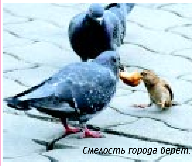
Смелость города берет.