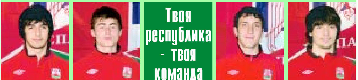
Азамат МЕРОВ, защитник