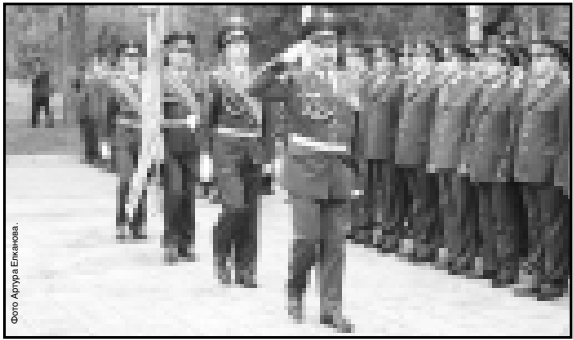
Для поддержания общественной стабильности