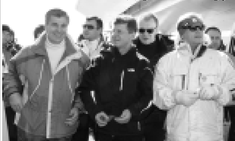
Арсен Каноков, Дмитрий Козак и Леонид Тягачев на церемонии открытия новой канатной дороги.