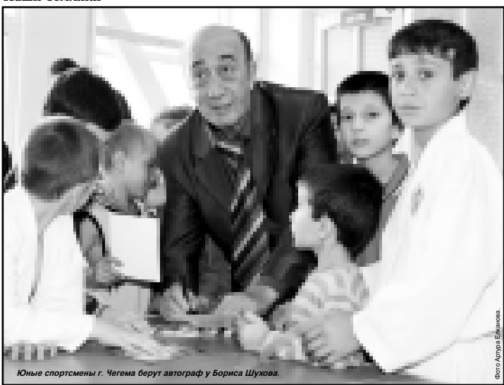
Юные спортсмены г. Чегема берут автограф у Бориса Шухова.