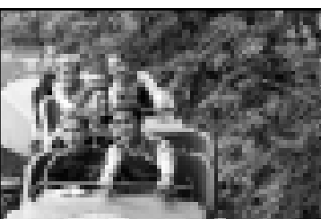
В городском парке детворе было весело.

(Окончание. Начало на 1-й с.) Открывая программу «Город мой – моя семья», на сцену вышли артисты Государственного ансамбля песни и пляски Терских казаков...»