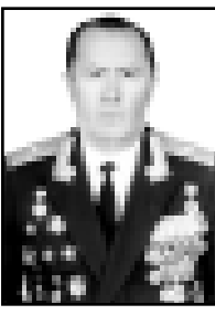
Кабардино-Балкарский Совет ветеранов