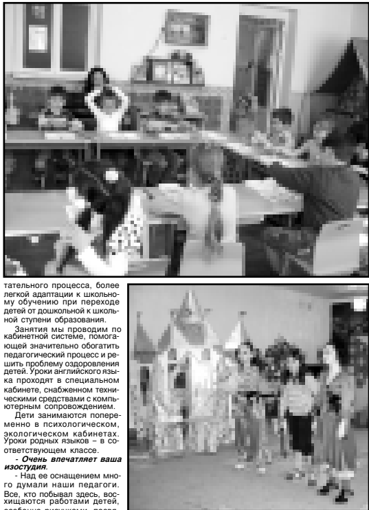
представлена и в кабинетах родного языка. Кстати, эстетическому развитию ребенка, равно как и физическому, уделяется много внимания. У нас хорошо оборудован-