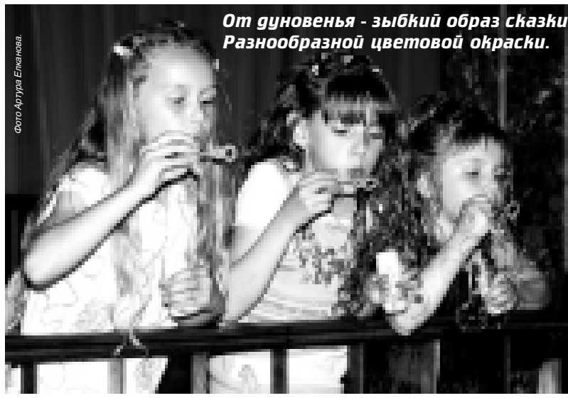
От дуновенья - зыбкий образ сказки Разнообразной цветовой окраски.