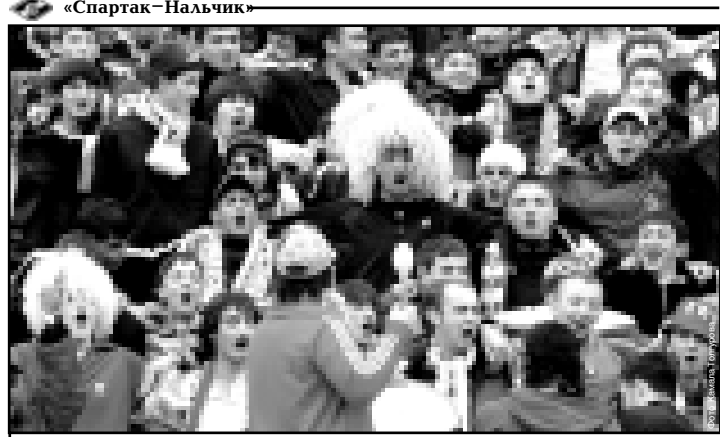
«Спартак» - Нальчик»

Забота о детях - один из основных приоритетов устроителей праздника. Ребятишки будут отдыхать и развлекаться на сорока игровых площадках до вечера 15 августа. Расцветят радужными гирляндами огней Нальчик предстанет во всем своем праздничном великолепии.