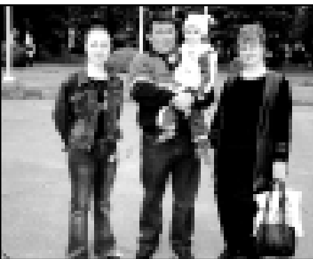
Репринт: «КБП» 50 лет назад