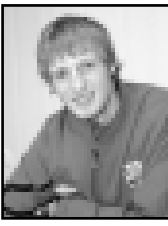
У нас довольно-таки молодая команда. Много новых людей. В период предсезонной подготовки приехали столько народу, что трудно было даже запомнить их имена...