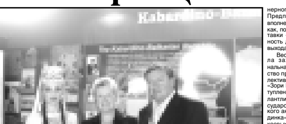
День Кабардино-Балкарии стал настоящим праздником для жителей и гостей города.