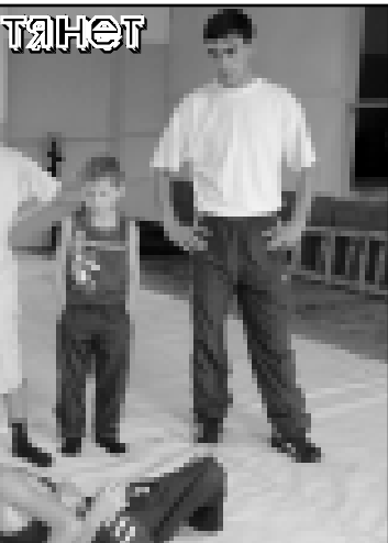
Положить соперника на лопатки - дело непростое. Мальчишки пока только учатся.

Вот уже четыре года в селе Жемтала Черекского района действует спортивная школа. Пристобили под нее старинные кизилы, а строительными работами занимались сами тренеры.