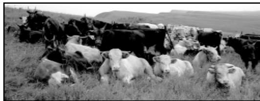
Сочная трава – тулчье стадо.