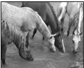
Ходят кони к водою.

Приход от чистокровных арабских лошадей «Алина» получает с 1997 года. С первой же ставки был получен великолепный жеребец Плейбиди (Бахрейн-Прима), родившийся в 1998 году. В 2001 году Плейбиди победил во всемирном скаковом дерби. Другой блестящий арабский скакун Беспечальный, типичный кохейлан (Приказ-Балетта) выиграл в 2002 году московское дерби. Такой же приз в 2004 году достался Энджелу (Академик - Экспертиза). В 2003-2004 годах Беспечальный и Энджел выигрывали Кубок России. Наконец, в прошлом году кобыла Нинель (Нугатин-Наука) была второй в московском дерби, проиграв лишь полукровку вывезенному из Франции скакуну, которого в КБФ, слава Богу, не знали. В обозримом будущем импортеры страны будут украшены выступлениями перспективных жеребят «Алины».