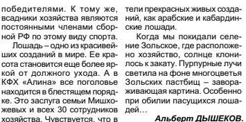
Жеребец Беспечальный - гордость хозяйства.

Для испытанной кабардинской лошадей используют дистанционные пробеги, где конники «Алины» неоднократно становились призерами и победителями. К тому же, всадники хозяйства являются постоянными членами сборной РФ по этому виду спорта. Лошадь - одно из красивейших созданий в мире. Ее красота становится еще более яркой от должного ухода. А в КБФ «Алина» все поголовье арабских пастбищ - заора живущая картина. Особенно при обилии пасущихся лошадей... Ольга Камала Толсурова.