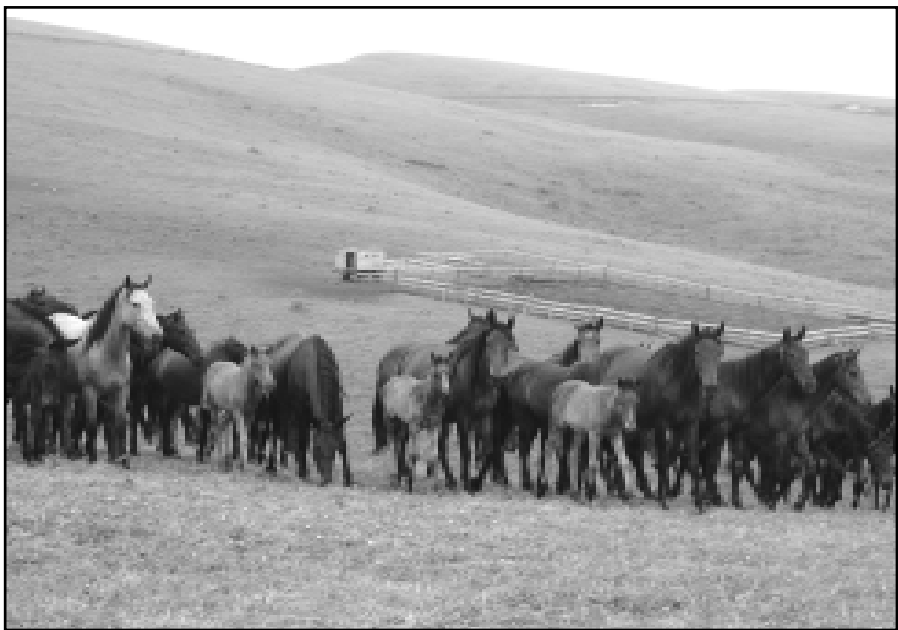
Украшение Зольских пастбищ – табуи кабардинских лошадей.