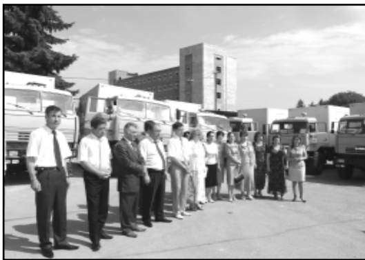
Главные врачи районных больниц и поликлиник собрались, чтобы получить новую технику.