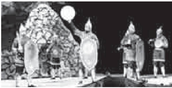
Сорка артистов, включая наших земляков, подождала к реализации своих планов вплотную...