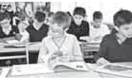
новой книгой, но и приняли активное участие в знаменитой викторине, посвящённой истории первого кругосветного путешествия кораблём российского флота...