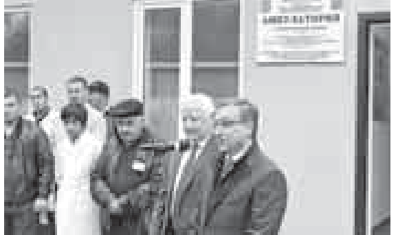
(Окончание на 2-й с.)

Напомним, что с сентября 2014 года, когда было принято решение об обновлении материальной базы первичного звена сельского здравоохранения Кабардино-Балкарии, уже 49 ФАПов и 10 сельских амбулаторий получили новые помещения и современное оборудование. Тогда было принято справедливое реше-