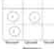
Матрица рисков реализации Плана в Кабардино-Балкарской Республике

В целях минимизации влияния рисков используются следующие меры управления рисками: 1) централизация ресурсов на решении приоритетных задач КППО и развитии транспортной инфраструктуры, которая будет способствовать созданию благоприятных условий для социально-экономического развития Кабардино-Балкарской Республики и решению важнейших задач государственной транспортной политики; 2) выявление наиболее критичных объектов транспортной инфраструктуры и причин снижения качества транспортного обслуживания;