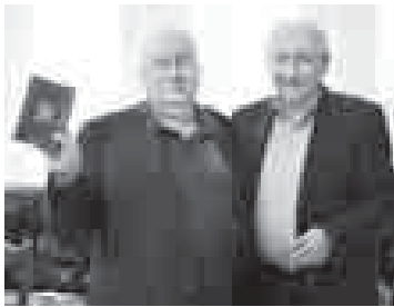
Участники встречи сошлись во мнении: если журналисты объединятся, будут проще решать политические, социальные, экономические и культурные проблемы.