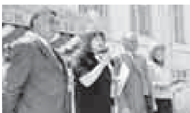
В школах Чегемского района прозвенел последний звонок для 350 выпускников 11-х классов и 620 девятиклассников.