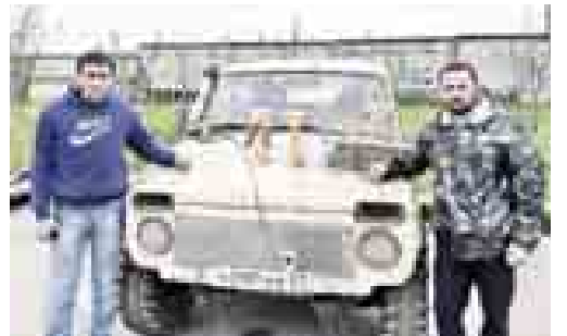
Первые в рейтинге Кубка СКФО

В п. Саниа Республики Северная Осетия-Алания прошёл джип-спринт в зачёт первого этапа Кубка СКФО, посвящённый 70-летию Победы в Великой Отечественной войне, на котором отличились члены внедорожного клуба «Кабарда – 4x4» из Урванского района.