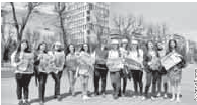
1 апреля во всех почтовых отделениях стартовала основная подписная кампания на периодические печатные издания на второе полугодие текущего года. Желающие оформить подписку на интересные издания могут сделать это до конца июня в любом отделении Почты России.

Подпишись на газеты и будь в курсе событий, происходящих в республике! С таким призывом, вооружившись свежими номерами печатных изданий КБР, на главную улицу Нальчика вышли около пятидесяти волонтеров Кабардино-Балкарского молодёжного многофункционального центра.