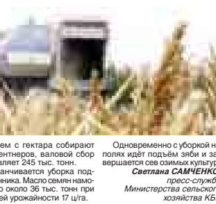
Светлана САМЧЕНКО, пресс-служба Министерства сельского хозяйства КБР

Благоприятные погодные условия позволяют на полях Кабардино-Балкарии завершить осенние полевые работы. По оперативным данным, кукурузы на зерно с площади порядка 110 тыс. га собрано более 660 тыс. тонн, средняя урожайность – свыше 60 центнеров с гектара. С открытого грунта овощные культуры убраны с 15,8 тыс. га (95 процентов). При средней урожайности около 200 ц/га валовой сбор составляет 310 тыс. тонн. Картофель осталось убрать с двух процентов площадей. В среднем с гектара собирают 200 центнеров, валовой сбор составляет 245 тыс. тонн. Заканчивается уборка подсолнечника. Малым масштабом уборено около 36 тыс. тонн при средней урожайности 17 ц/га.