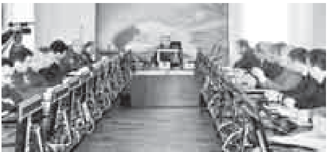
(Окончание. Начало на 1-й с.)