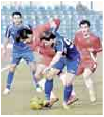
Первенство ПФЛ, зона «Юг», вторая группа. Положение на 9 ноября 2014 г.