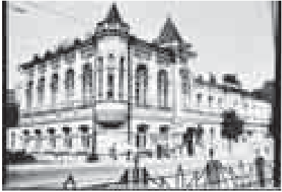
Здание, в котором был открыт Кабардино-Балкарский педагогический институт, г. Пятигорск 1932 г.

Один из старейших вузов Северного Кавказа – Кабардино-Балкарский ордена Дружбы народов Государственный университет им. Х.М. Бербекова отметил 82-летие. Свою историю он начал в 1932 году как Кабардино-Балкарский педагогический институт, а в 1957-м был преобразован в университет.