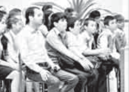
В мероприятии также приняли участие руководство района, представители общественных и религиозных организаций...

В Национальной библиотеке имени Т.К. Мальбахова в комплексном мероприятии «Час памяти» приняли участие учащиеся восьмых классов нальчикской школы №5.