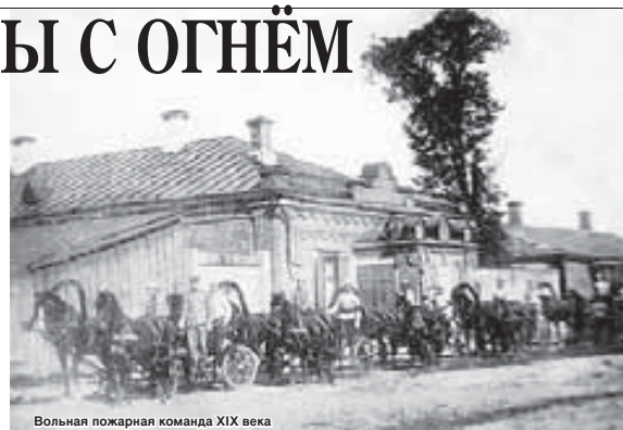
Вольная пожарная команда XIX века

В 1918 г. с принятием декрета «Об организации государственных мер с огнём» не только в России, но и в мире охрана народного достояния от пожаров была поставлена на государственный уровень.