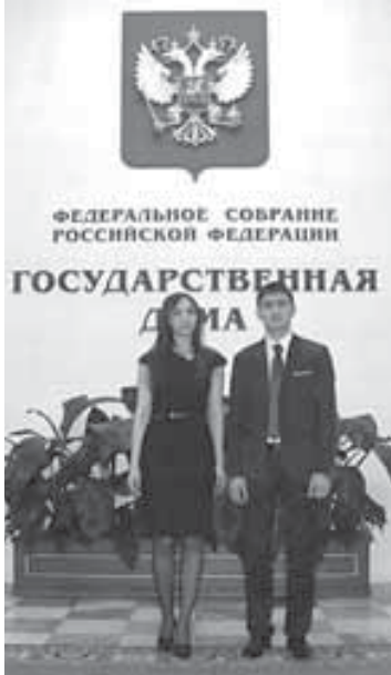
ФЕДЕРАЛЬНОЕ СОБРАНИЕ РОССИЙСКОЙ ФЕДЕРАЦИИ ГОСУДАРСТВЕННАЯ ДУМА

где будут чётко прописаны основные определения медицинского интернет-консультирования: цели, за-