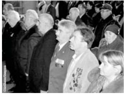
Борис Громов, Герой Советского Союза

Эти строки написал командующий 40-й армией, Герой Советского Союза генерал-лейтенант Борис Громов 15 февраля 1989 года, когда последний бронетранспортер с нашими воинами пересек мост Дружбы через Амударью.