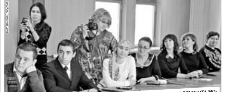
В КОНФЕРЕНЦ-ЗАЛЕ ДЕПАРТАМЕНТА МОЛОДЕЖНОЙ ПОЛИТИКИ ПРОШЛО НАГРАЖДЕНИЕ ПОБЕДИТЕЛЕЙ РЕПУБЛИКАНСКИХ КОНКУРСОВ «МОЛОДЕЖЬ ПРОТИВ КОРРУПЦИИ» И «КОРРУПЦИЯ ГЛАЗАМИ МОЛОДЕЖИ», ОБЪЯВЛЕННЫХ В ПРОШЛОМ ГОДУ.