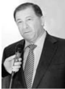
Хаути Сохроков, президент МЧА