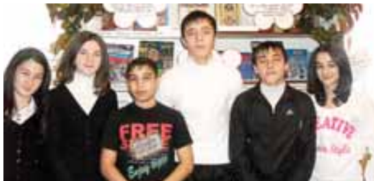
Материалы рубрики подготовили Альберт ДЫШЕКОВ, Анатолий ПЕТРОВ и Марина МУРАТОВА

В Верхнекурпальской сельской библиотеке Терского района провели цикл мероприятий, приуроченных к Олимпиаде в Сочи. Здесь прошли книжно-иллюстративные выставки, спортивно-познавательные мероприятия, викторины; состоялись презентации на тему Олимпийских игр, встречи с известными спортсменами.