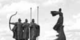
Легендарные основатели Киева: Кий, Шчек, Хорив и сестры их Льбедь. Скульптурная композиция на берегу Днепра

В Нальчике действует украинский культурный центр «Дніпро», в Прохладном — «Промінь». По статистике, более четырех тысяч украинцев живут в Кабардино-Балкарии.