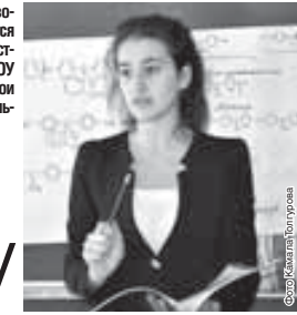
Сотрудница Кабардино-Балкарского государственного университета им. Х.М. Бербекова

Уже более двадцати лет Республиканский Дворец творчества детей и молодёжи становится местом стечения юных исследователей — участников XXIII научной конференции учащихся НОУ «Сигма» «Творчество юных». В этом году свои работы на конференции защищали 350 школьников из всей Кабардино-Балкарии.