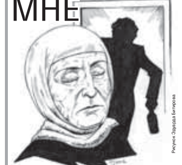
Рисунок: Зарина Батраева