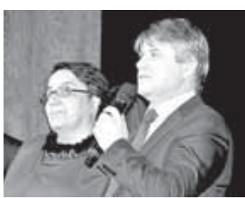
за эти годы: задачи, приоритеты, подходы к работе, но неизменными в нашем колледже остались энергия, желание совершенствоваться, постигать новые горизонты. Самым главным нашим активом и сегодня являются профессиональные сотрудники и студенты». В этот день говорили о лю-

качественными преобразованиями в системе среднего профессионального образования. В 1996 году колледж стал структурным подразделением КБГУ. «70 лет – это возраст творческой активности и мудрости, накопленного опыта и сложившихся традиций», – отметила она. – Многие изменились