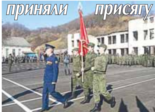
66 кадетов – старшеклассники и ученики пятых классов кадетской школы-интерната с. Бабугент Черкесского района – приняли присягу.