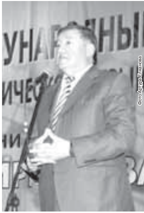
Чем является мировое симфоническое искусство. И мы горды, что наш выдающийся земляк Юрий Темirkanov вошёл на этот олимп.

которого высоко и по достоинству оценено всеми, кому дорога симфоническая музыка. Но они с признательностью откликнулись на приглашение министерств культуры РФ и КБР выступить на фестивале его имени. По словам Виктора Ямпольского, коллектив «Трио имени Рахманинова» уже не в первый раз приезжает в Нальчик. На сцене нашего города музыканты выступили со знаменитыми иностранными артистами, давали мастер-классы в Северо-Кавказском государственном институте искусств. Они отметили, что почувствовали тепло зала, ощутили незримый диалог со зрителями: «Публика Нальчикская замечательная, мы почувствовали это ещё в предыдущие приезды. Говоря об исполнении Шостаковича, музыканты пояснили, что намеренно выбрали «столь сложную, неадаптированную программу».