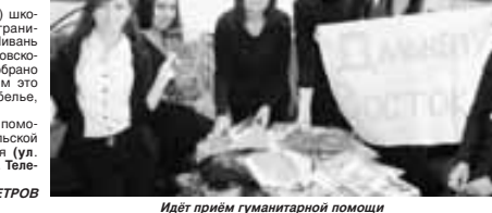
Идет приём гуманитарной помощи

специальной (коррекционной) школы-интерната для детей с ограниченными возможностями с. Пивань Комсомольского района Хабаровского края. За короткое время собрано около 50 вещей, в основном это теплая одежда, постельное белье, книги и канцтовары. Пункт приема гуманитарной помощи расположен в здании сельской администрации Дыгульбегей (ул. Баксанова, 32, первый этаж). Телефон (8866344)-72-01.