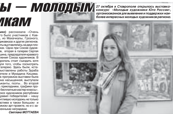
27 октября в Ставрополе открылась выставка-конкурс «Молодые художники Юга России»...