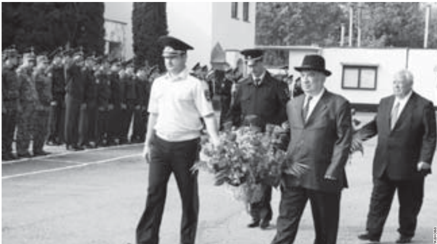
В Нальчике состоялось первенство СКФО по борьбе памяти сотрудников органов внутренних дел, погибших при исполнении служебного долга.