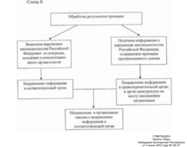
УТВЕРЖДЕНО Кабинетом Правительства Кабардино-Балкарской Республики от 4 июня 2012 года № 85-УТ