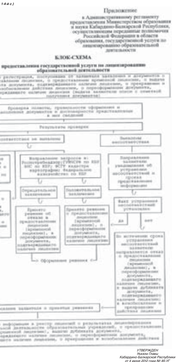
УТВЕРЖДЕН Указом Главы Кабардино-Балкарской Республики от 4 июня 2012 года № 85-У