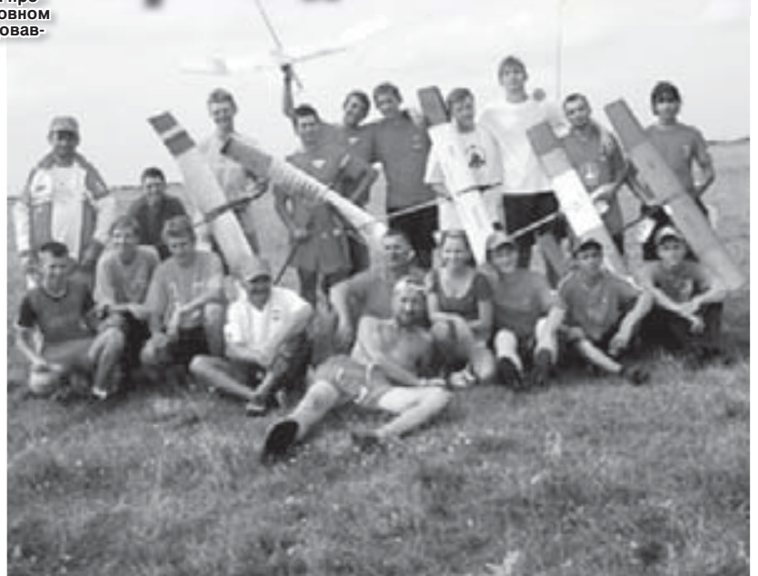
Следующий номер газеты выйдет 3 мая.

☎ 42-69-96 ОБЪЯВЛЕНИЯ РЕКЛАМА ОБЪЯВЛЕНИЯ РЕКЛАМА ОБЪЯВЛЕНИЯ РЕКЛАМА ОБЪЯВЛЕНИЯ ☎ 42-69-96 E-mail: kbrcel@mail.ru