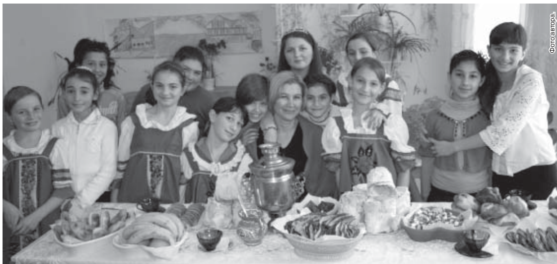
Воспитанники детского объединения «Кулинария».